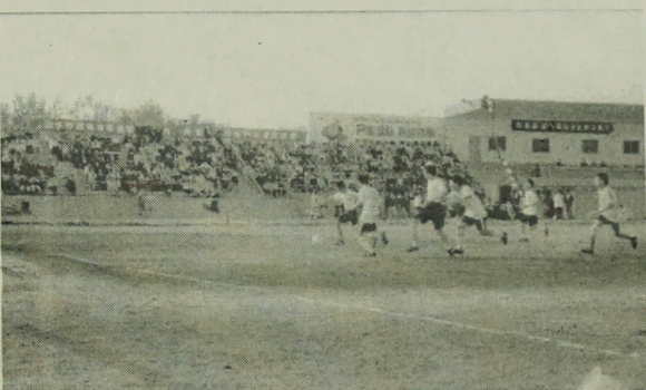
山东纺校首届足球联赛首场比赛