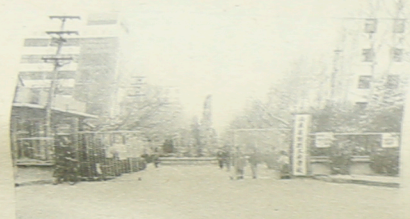
校门剪影

当前，纺织行业不十分景气， 社会上许多人对此议论纷纷，“跳 槽”现象更是屡见不鲜。所有关心 纺织支持纺织的人们，有的叹息、 忧虑，但更多的是为其发展寻求出 路……山东纺校作为一所培养纺织 人才的省部级重点专业学校，它的 学生们对目前出现的这种现象是如 何看待的？他们的心态又是怎样的 呢？