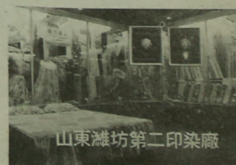
潍坊二印生产的部分出口产品