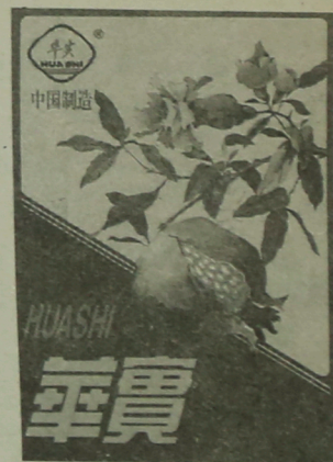
潍坊二印新注册的“华实”商标

技术，采用激光制版代替传统的人工调浆及制版，通过技术改造，使我厂的工艺设备水平在短时期内有一个大的提高，继续保持同行业领先地位。 二是围绕提高企业的创汇能力，不断完善自我配套，引进和配套缝制设备137台，利用自产优质特宽幅装饰布形成年产15万件标准缝被，10万套三件套床上用品，80万米缝制装饰物的加工能力，扩大高附加值、高创汇产品的生产。 三是围绕提高企业的应变能力，不断开发新品种。重点开发金银粉印花、珠光印花、彩墨印花、彩色罩印、印花等五大系列特殊涂料印花产品，细旦、超细旦人棉纺丝绸产品，防菌、隔热、阻燃等特种整理产品，纯棉高支、高密产品，以适应市场变化和不同层次消费者的需求。计划到“九五”末高新技术产品年产量达到4000万米，产值4亿元，创汇4000万美元。 我厂地理位置优越，北临济青高速公路，南接贯通市区的交通干道，